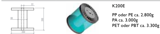
K200E PP oder PE ca. 2.800g PA ca. 3.000g PET oder PBT ca. 3.300g