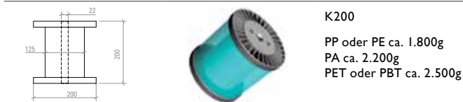
K200 PP oder PE ca. 1.800g PA ca. 2.200g PET oder PBT ca. 2.500g