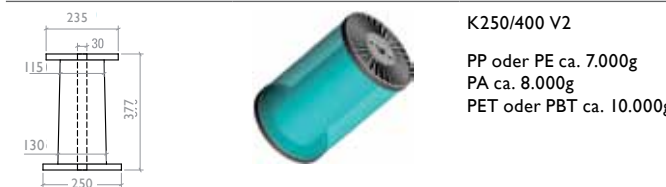
K250/400 V2 PP oder PE ca. 7.000g PA ca. 8.000g PET oder PBT ca. 10.000g

Konischer Spulenaufbau Conical Bobbin Building