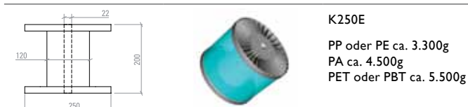
K250E PP oder PE ca. 3.300g PA ca. 4.500g PET oder PBT ca. 5.500g