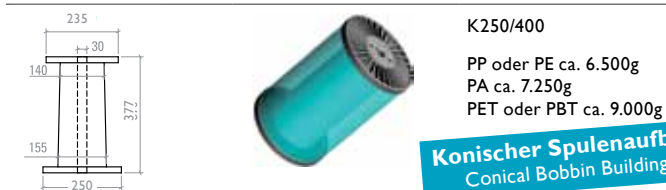
K250/400 PP oder PE ca. 6.500g PA ca. 7.250g PET oder PBT ca. 9.000g

Konischer Spulenaufbau Conical Bobbin Building