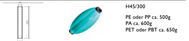
H45/300 PE oder PP ca. 500g PA ca. 600g PET oder PBT ca. 650g