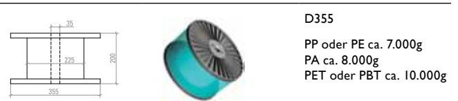
D355 PP oder PE ca. 7.000g PA ca. 8.000g PET oder PBT ca. 10.000g