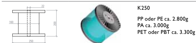
K250 PP oder PE ca. 2.800g PA ca. 3.000g PET oder PBT ca. 3.300g