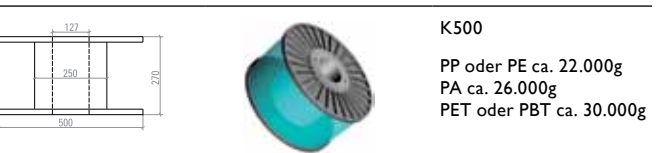
K500 PP oder PE ca. 22.000g PA ca. 26.000g PET oder PBT ca. 30.000g