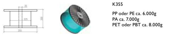
K355 PP oder PE ca. 6.000g PA ca. 7.000g PET oder PBT ca. 8.000g