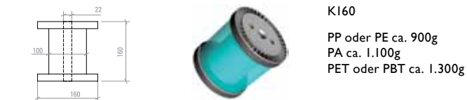
K160 PP oder PE ca. 900g PA ca. 1.100g PET oder PBT ca. 1.300g