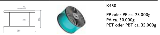
K450 PP oder PE ca. 25.000g PA ca. 30.000g PET oder PBT ca. 35.000g