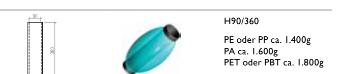
H90/360 PE oder PP ca. 1.400g PA ca. 1.600g PET oder PBT ca. 1.800g