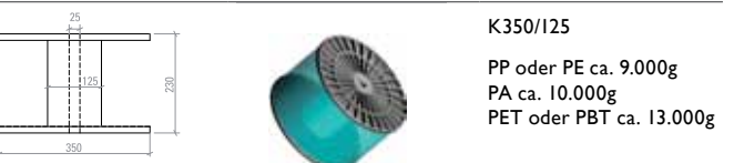
K350/125 PP oder PE ca. 9.000g PA ca. 10.000g PET oder PBT ca. 13.000g